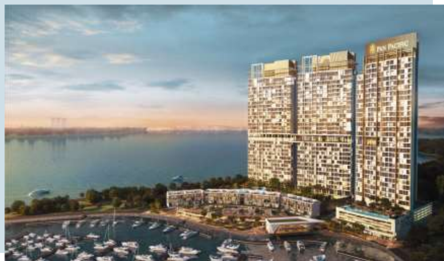
公主湾公寓和商铺, 马来西亚依斯干达公主湾 预计竣工：2017年底