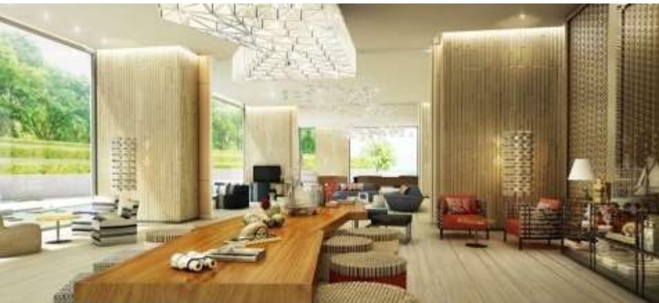
大堂与游戏俱乐部 | 宽敞明亮、豪华时尚的休闲厅