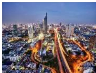
通往市区的高速公路