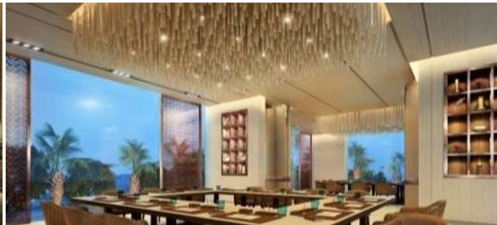
功能室 | 三间多功能室，满足您的社交需求