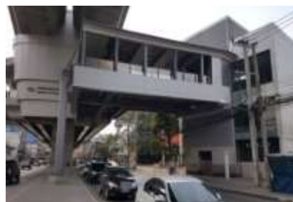
公共卫生局地铁站