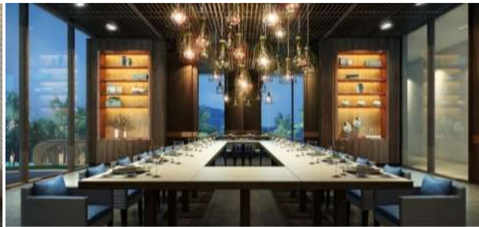
私人餐厅 | 舒适优雅地会友用餐