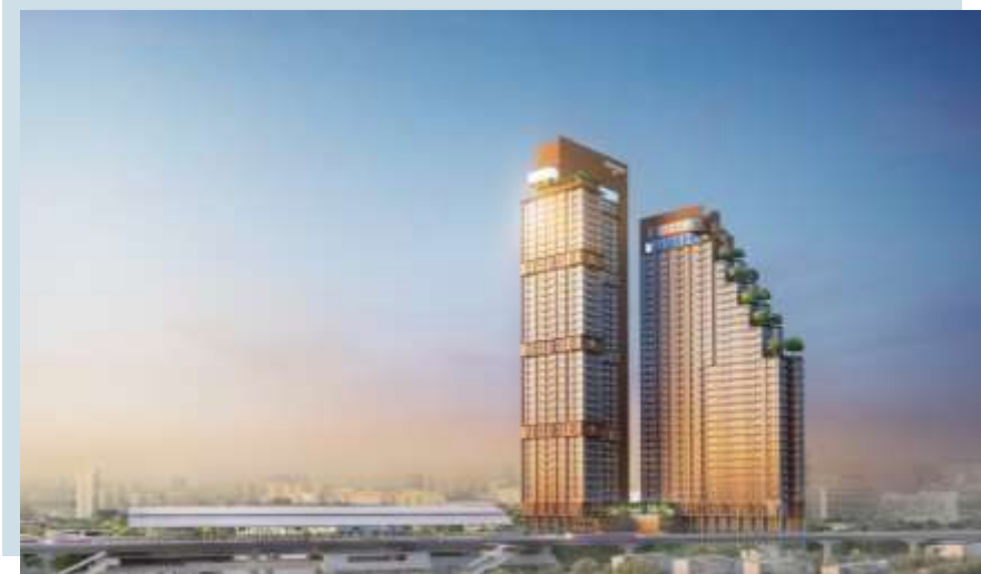
The Posh Twelve, 曼谷 以经开始在多国销售