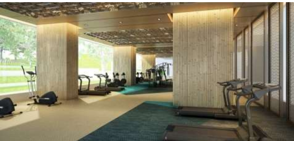
健身房 | 三间健身厅，拥有完善的健身器材